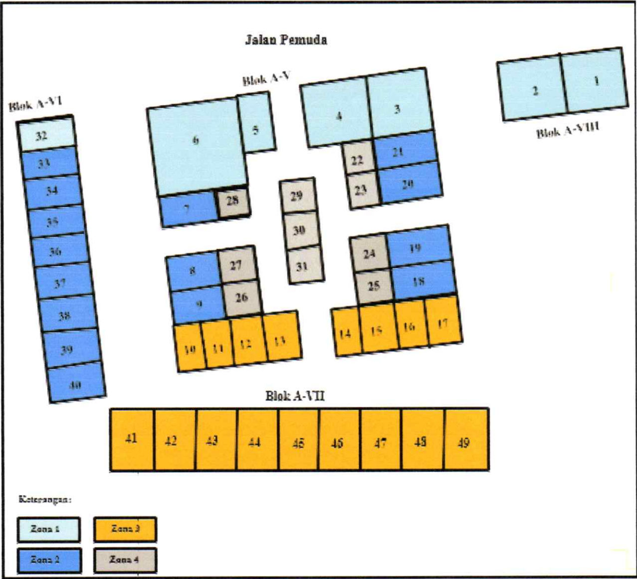
GAMBAR DENAH TANAH DAN BANGUNAN PLAZA MUNTILAN KABUPATEN MAGELANG